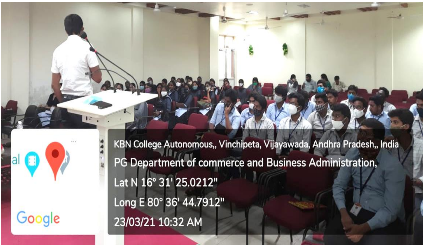
KBN College Autonomous,, Vinchipeta, Vijayawada, Andhra Pradesh,, India PG Department of commerce and Business Administration, Lat N 16° 31' 25.0212" Long E 80° 36' 44.7912" 23/03/21 10:32 AM