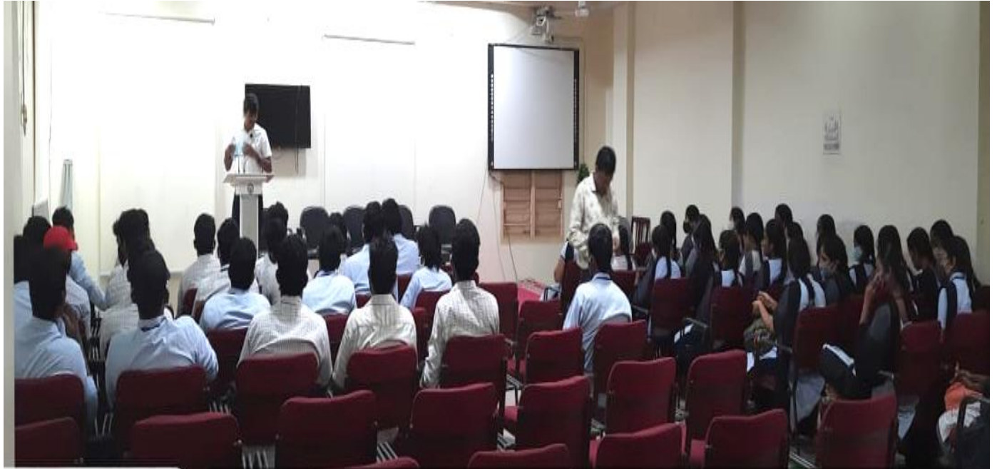
KBN College Autonomous,, Vinchipeta, Vijayawada, Andhra Pradesh,, India